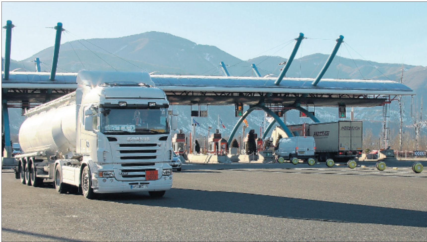
Certains transporteurs des Hautes-Alpes annoncent des baisses de 20 à 25 % de leur chiffre d'affaires, cette année.

Les transporteurs routiers haut-alpins affichent généralement une baisse de leur activité, qui affecte aussi l'emploi dans ce secteur. Les professionnels invoquent les effets de la crise, renforcés par une concurrence déséquilibrée avec les transporteurs étrangers.