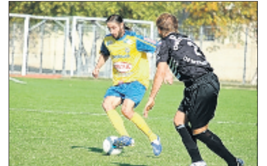
Les Gapençais de Firquet reçoivent les réservistes de Montpellier à 18 h au stade de Provence. L'occasion d'enchaîner un troisième match sans défaite. Le DL/VIRGILE